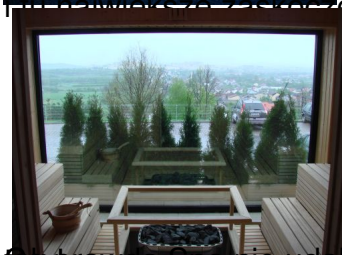
nie brawda Spa nie udało nam się przetestować, ale basen solankowy z bardzo ciepłą wodą już