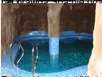
Zobaczcie jak pięknie jest wyposażony i jak bardzo wygodnie jest się w nim kąpać jak w domu